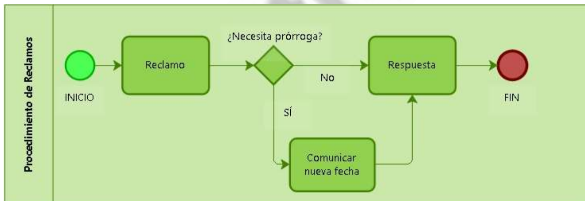
Figura 2. Procedimiento reclamos.

Los reclamos 3 serán atendidos en un término máximo de quince (15) días hábiles contados a partir del día siguiente a la fecha de recibo del mismo. Teleantioquia podrá prorrogar este término en casos especiales dando aviso al interesado. Este nuevo plazo no podrá superar los ocho (8) días hábiles siguientes. A continuación, se relaciona el diagrama correspondiente: