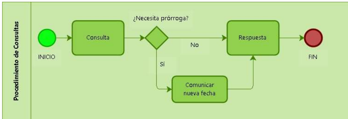
Figura 1. Procedimiento consultas.

Los reclamos 3 serán atendidos en un término máximo de quince (15) días hábiles contados a partir del día siguiente a la fecha de recibo del mismo. Teleantioquia podrá prorrogar este término en casos especiales dando aviso al interesado. Este nuevo plazo no podrá superar los ocho (8) días hábiles siguientes. A continuación, se relaciona el diagrama correspondiente: