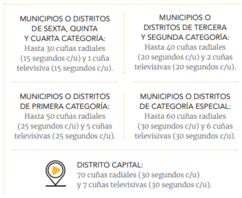
Gráfico tomado del Manual de Cubrimiento Electoral y Libertad de Prensa publicado en el año 2019 por la FLIP (Fundación para la Libertad de Prensa) y la MOE (Misión de Observación Electoral).